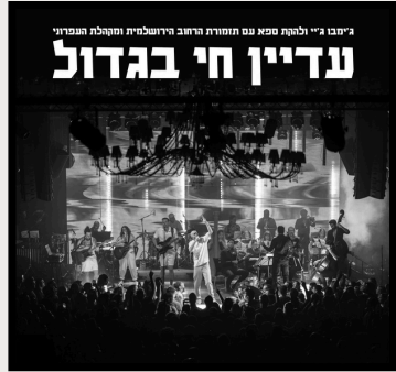
ג'ימבו ג'י ומקהלת העפרוני "עדיין חי בגדול" לינק להאזנה