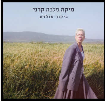
מיקה מלכה קרני "ביקור מולדת" לינק להאזנה