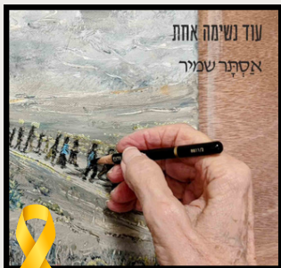
תשומת לב מיוחדת אסתר שמיר "עוד נשימה אחת" כל מה שהיינו רוצים לומר להם ששם, עד שיחזרו. לינק להאזנה