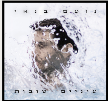
נועים בנאי "נועים טובות" לינק להאזנה